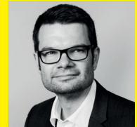
Gyde Jensen MdB

Erster parlamentarischer Geschäftsführer