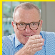
Thomas Sattelberger MdB Mitglied des deutschen Bundestags ehem. Personalvorstand bei Dt. Telekom AG und Continental AG